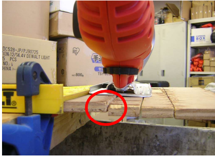
母材が下側に落ちようとたわんでいる(後ろ側から)

母材を切断していくと切断した端の板が下側に落ちようとたわみジグソーブレードを押し直ぐ切れないことがございます。