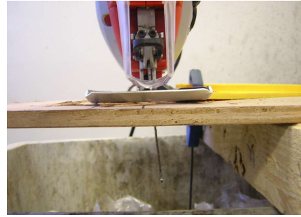
ジグソーブレードが曲がっている(前側から)

たわみにくいよう下写真のように切断線の両側を固定するようお勧めいたします。また、左右に力が加わらないよう真上から本機を押さえつけゆっくりと押し進めて頂きますようお願い致します。